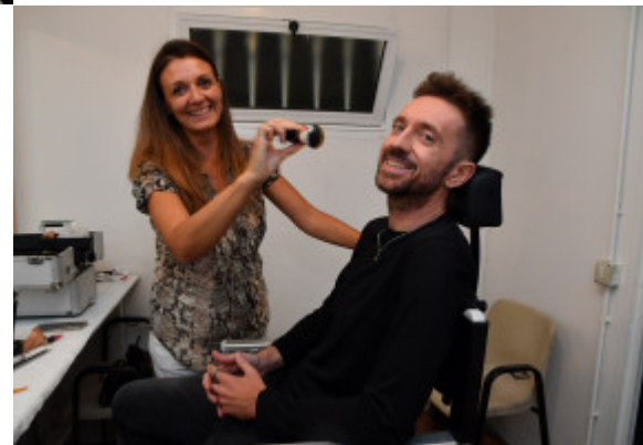
Tutti i sorrisi di Berlinguer, Floris, Zingaretti e Landini