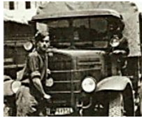
L'ipocrisia svelata sul soldato Olivotto