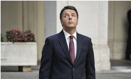
Il presidente del Consiglio Matteo Renzi

ROMA - "Venite in Italia, i nostri ingegneri sono bravissimi e costano molto meno che altrove". Si potrebbe sintetizzare in questo modo, secondo Eleonora Voltolina, fondatrice della Repubblica degli Stagisti, la voce dei giovani precari e sottopagati, il messaggio che il ministero dello Sviluppo lancia con la brochure che si può scaricare dal sito Investinitaly , con il logo del Ministero dello Sviluppo Economico. La stessa brochure è stata distribuita pochi giorni fa a